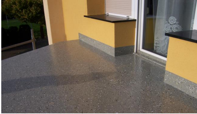
Partielle Abstreuerung mit Enke Kunststoffchips