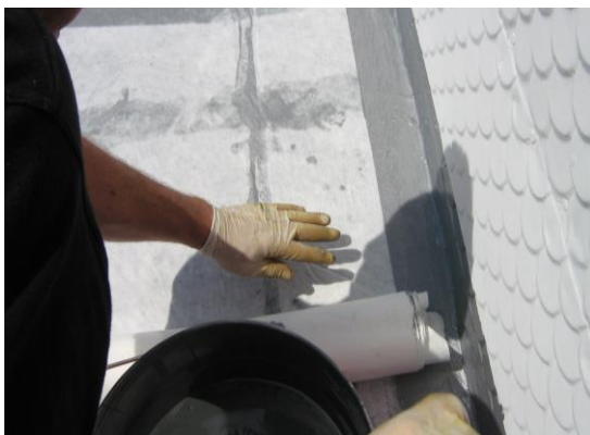
Enkopur – Abdichtung mit vollflächiger Enke - Polyflexvlieseinlage

Der Gesamtverbrauch an Enkopur richtet sich nach der Ebenheit des Untergrundes und liegt bei mind. 3,0 kg/m 2 (je nach Untergrundbeschaffenheit).