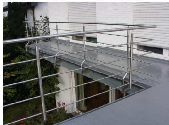
Abdichtung der Anschlüsse und der Fläche mit Enkopur.