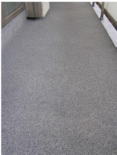
Vollflächige Abstreuerung mit Enke QuarzColor