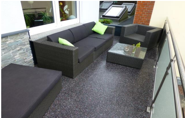
Vollflächige Abstreuerung mit Enketop Chips