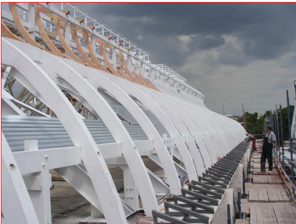
Bild 6 : Foto aus Montagephase für spätere Verklebung mit ENKOLIT