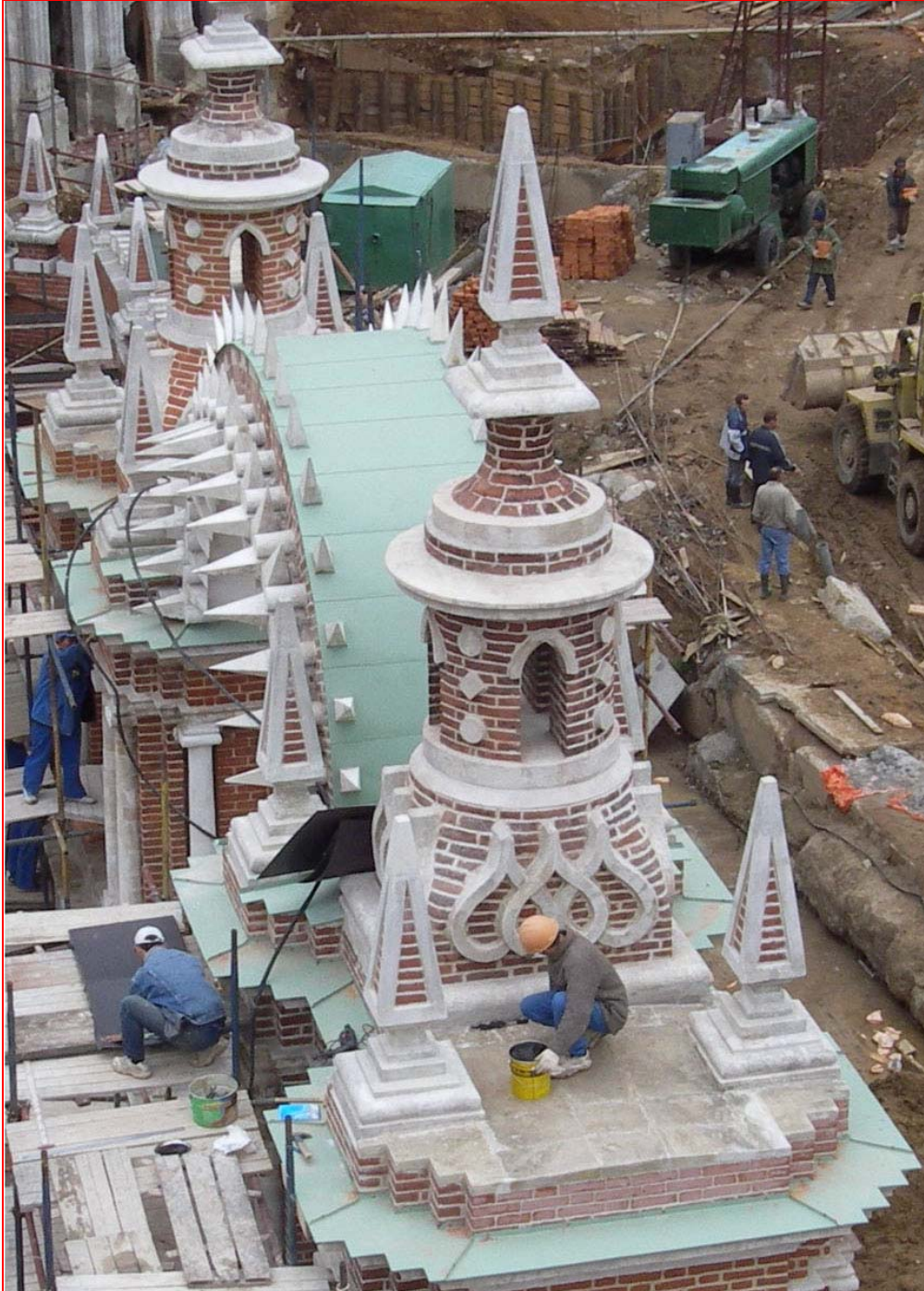
Bild 13 : Arbeiten mit ENKOLIT und fertig gestellte Gesimsabdeckung