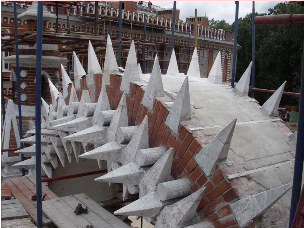
Bild 7 : Foto aus Montagephase für spätere Verklebung mit ENKOLIT