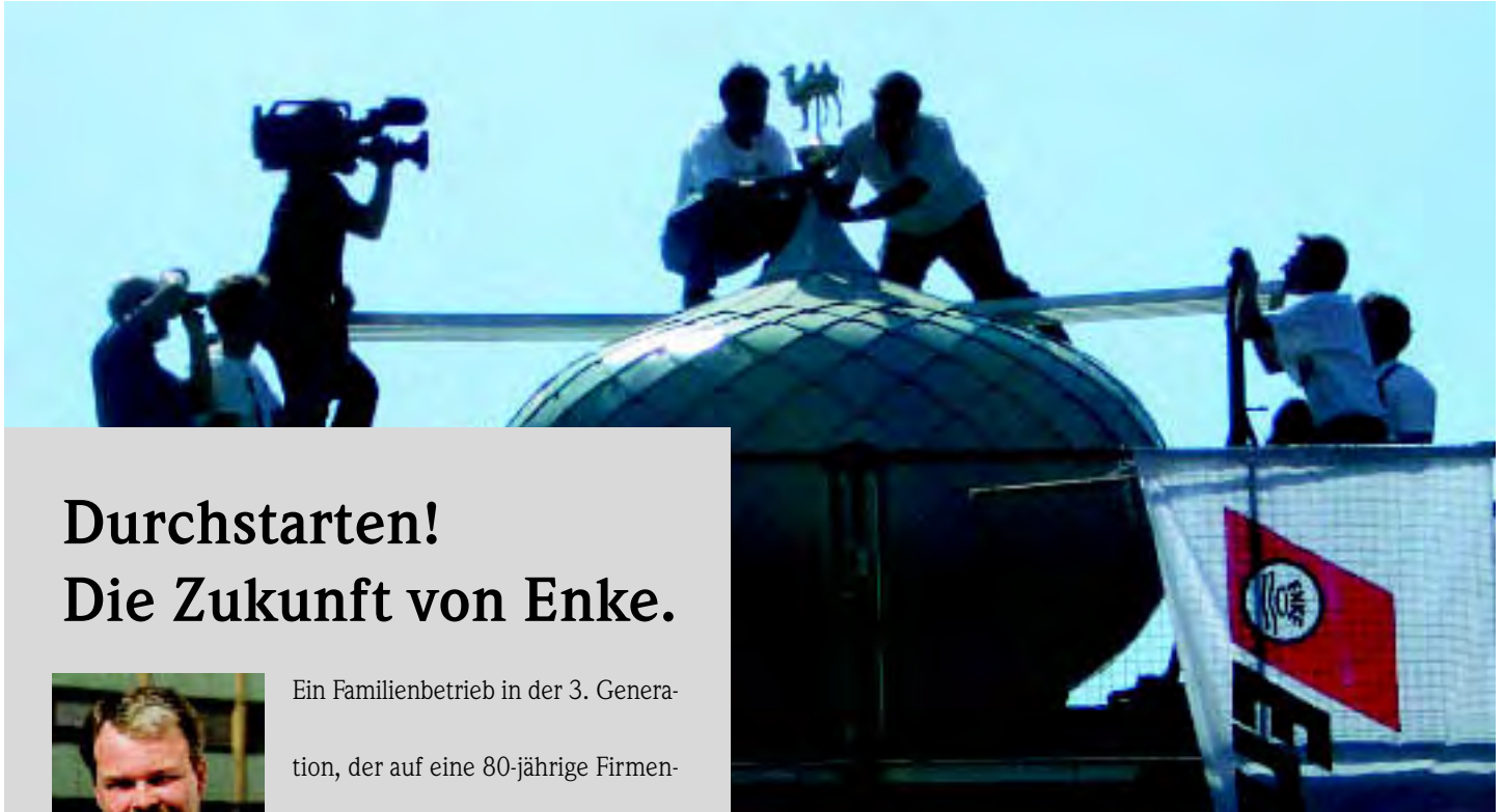
Der Orient lässt grüßen: eine Aluminiumkuppel für den Kamelhof in Rotfelden.

Informationen und Reportagen zum Thema Sanierung · Ausgabe 5