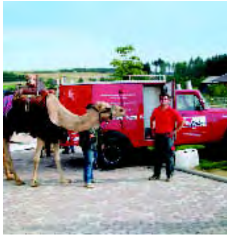
Ein Kamel sieht Rot: Das Enke Team ist da!