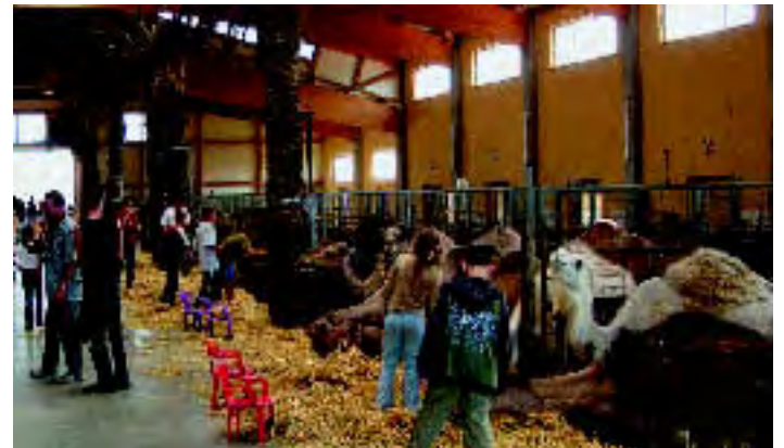
80 Kamele haben in Rotfelden bei Stuttgart ein Zuhause gefunden.

Der Grund für die Wahl des ungewöhnlichen Veranstaltungsortes: Unter der Leitung der Firma Buck aus Wildberg wurde eine orientalisches anmutende Aluminiumkuppel erstellt, die nun den Kamelstall ziert. Der Clou: Fachbetriebe konnten sich zu dieser Aktion anmelden, um die aufwändigen Arbeiten unter fachkundiger Leitung gemeinsam durchzuführen. Und wie kam die Abdichtung zwischen Kuppel und Dach zustande? Na klar: mit Enkopur von Enke! Außer von uns bekamen die Brüder Buck Unterstützung von zahlreichen Sponsoren, unter anderem von den Firmen Alcan, Barth, Engelhardt, KME, Rheinzink sowie von Roger Wanner und der Fachzeitschrift Baumetall.