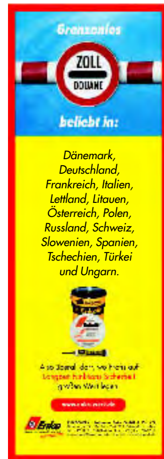
Ein Motiv unserer Fachanzeigen-Kampagne.