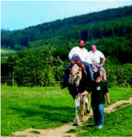
Mit dem Wüstenschiff durchs Schwabenland ...